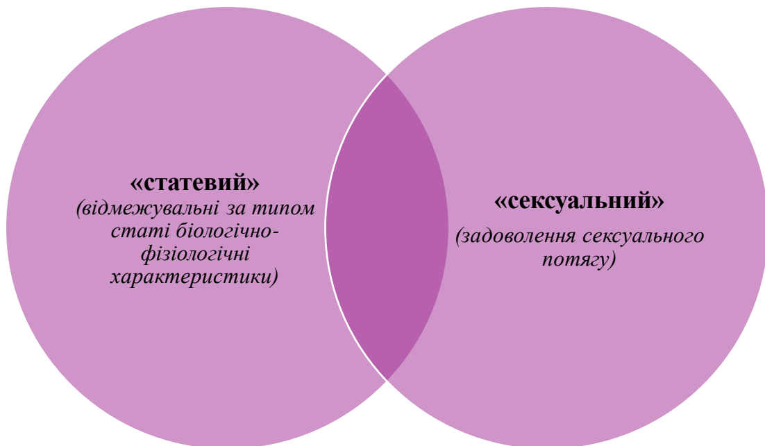
Рис. 2.1. Співвідношення слів «статевий» та «сексуальний»