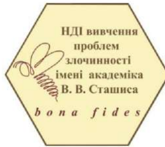
Науково-дослідний інститут вивчення проблем злочинності імені академіка В.В. Сташиса НАПрН України