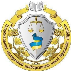
Національний юридичний університет імені Ярослава Мудрого