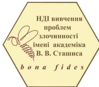
Науково-дослідний інститут вивчення проблем злочинності імені академіка В.В. Сташиса НАПрН України